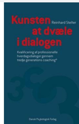
Stelter (2016). Kunsten at dvæle i dialogen , s. 160